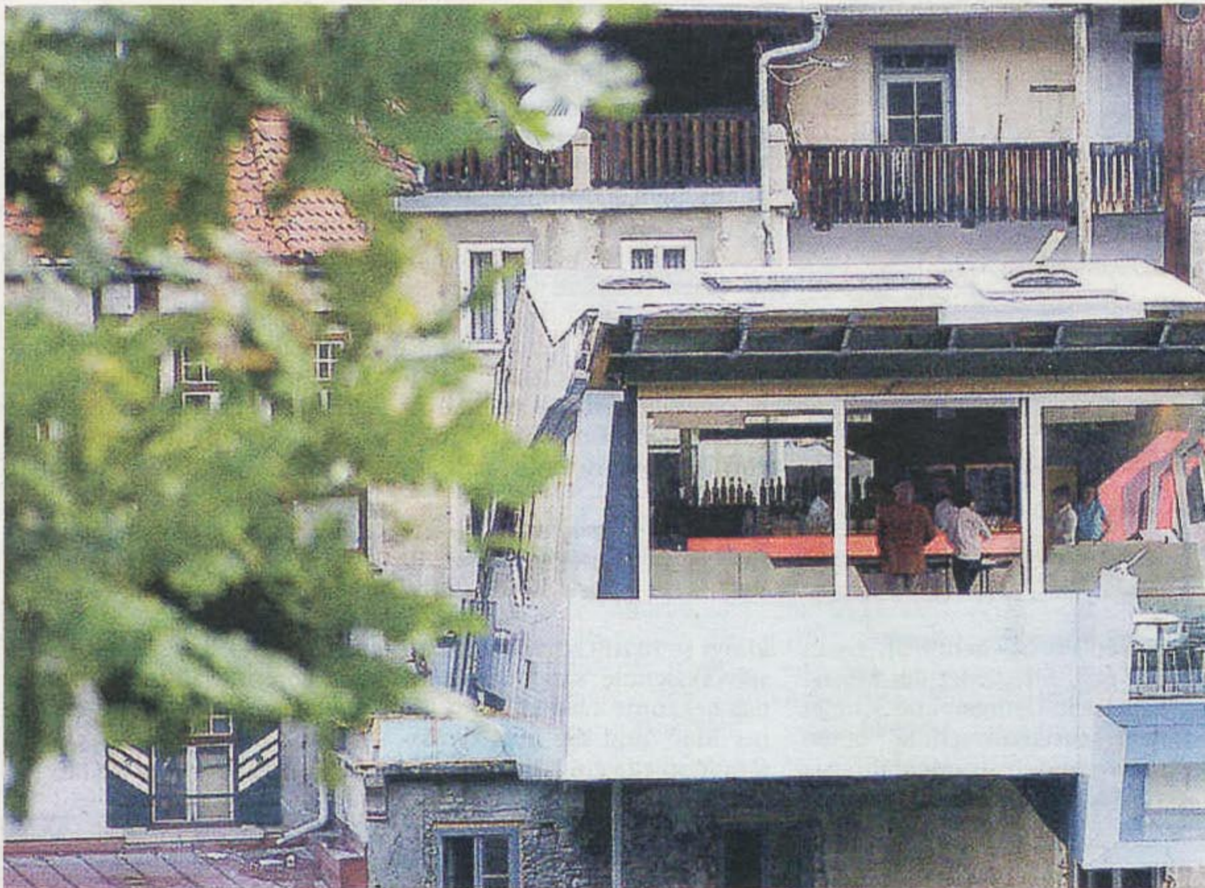
Gemütlich verweilen u. den herrlichen Ausblick genießen: „Open Space“ stellt eine Bereicherung der Murauer Gastro-Szene dar.

Erfreulicherweise wurden bei der Vergabe der Aufträge nach Möglichkeit renommierte Firmen aus dem Bezirk Murau beschäftigt. Und die haben wirklich tolle Arbeit geleistet. Spannend, wie sich die moderne Ar-